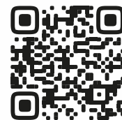
График работы: пн-пт 08.00 - 20.00, сб-вс 08.00-18.00

📍 Ижевск, ул. Архитектора Берша, 18 +7 (912) 856-10-99, +7 (3412) 56-10-99 📱 @faiberclinic